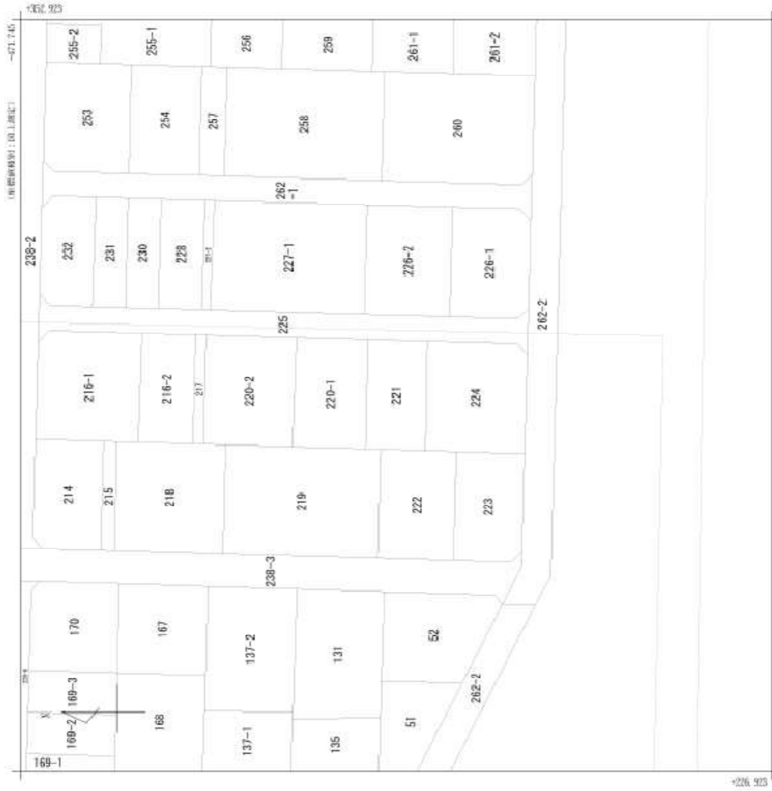
-E06.745- <経緯補綴別：図上真北>

(四) 国土交通省国土地理院が公表した標高補綴データ (todokataheisyoanki2011_nor) による標高が示されています。